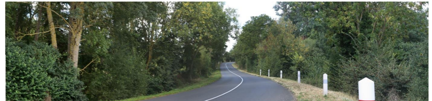
Photo 80 : Les routes recoupent les vallons dans lesquels les vues sont fermées (depuis la RD725 à hauteur du ruisseau de l'étang Fourreau)

Le motif éolien est déjà perceptible depuis une majorité des axes de communication de l'aire d'étude rapprochée, notamment depuis la RD938 auprès duquel les parcs sont implantés.