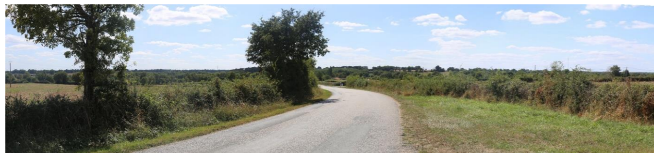
Photo 79 : Les situations topographiques en point haut offrent des vues ponctuellement lointaines – les haies basses permettent d'ouvrir les vues (depuis RD725 au nord-ouest de la ZIP et RD46 au sud-ouest de la ZIP)