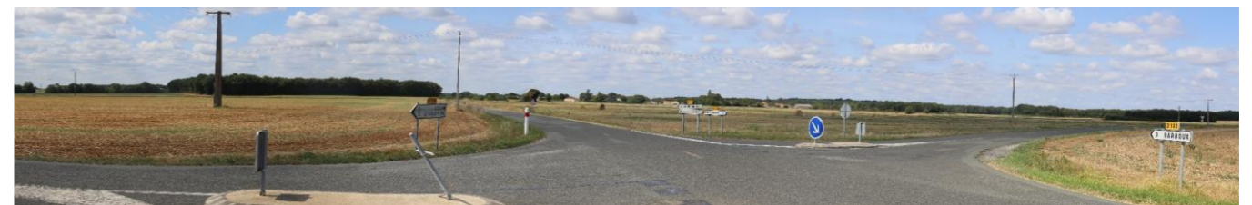
Photo 82 : Au nord-est de l'aire d'étude rapprochée, les paysages de plaines permettent des perceptions ouvertes ou semi-ouvertes (depuis RD27 au nord-est de la ZIP)