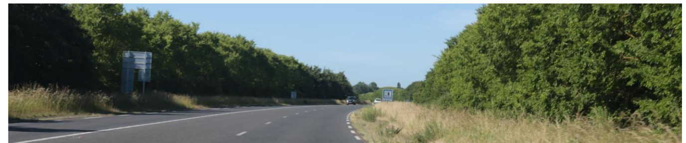
Photo 81 : Les haies arborées ferment les perceptions (depuis RD938 et RD46 au sud de la ZIP)